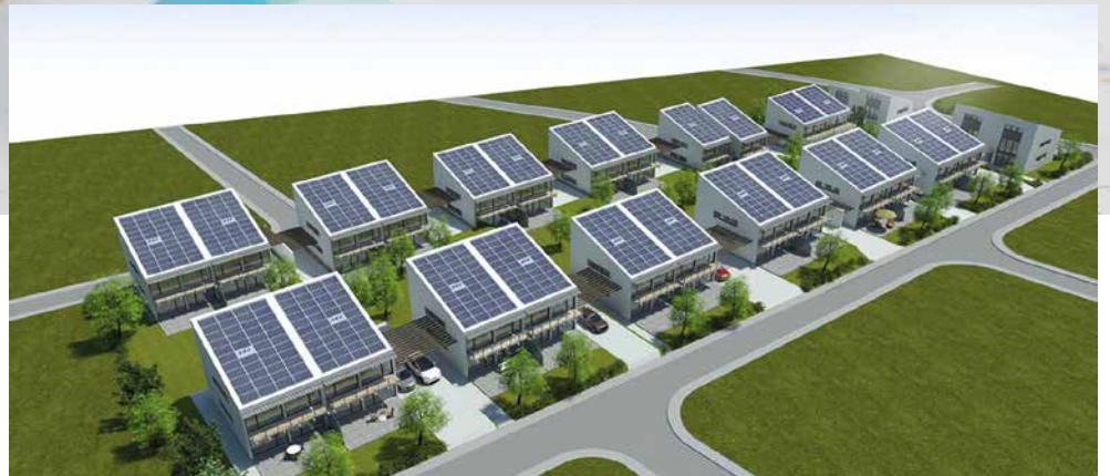
Das Solar-Quartier „In den Weingärten“ in Bad Kreuznach

Die Welt braucht nachhaltige Lösungen in der Energiefrage.