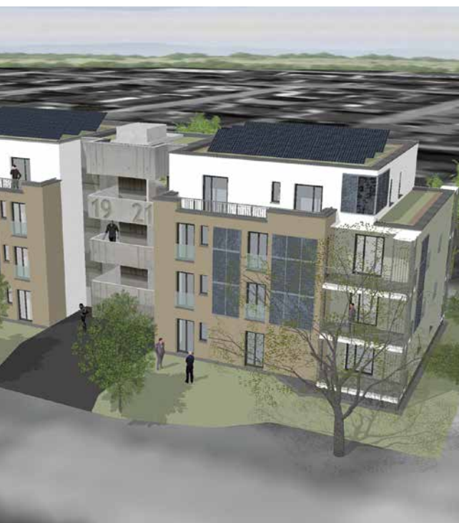
„KUB“ – klimaneutrales und barrierefreies Wohnkonzept in der Schubertstraße

Faire Mieten und ein moderner Wohnraum sind einfach überzeugende Pluspunkte für mich.