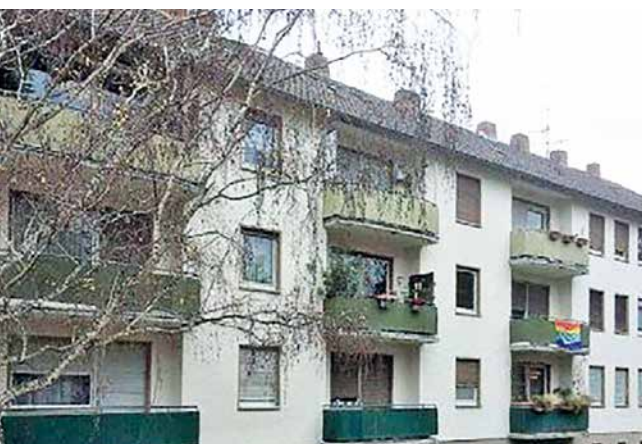
Energetische Sanierung bei Bestandsbauten – in der Steinkaut