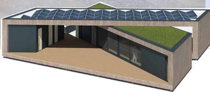
Bürgerpavillon als Quartiersmittelpunkt

Wir sind ein verlässlicher Partner unserer Mieterinnen und Mieter sowie der Menschen in der Region. Wir fördern regionale Kultur- und Freizeitaktivitäten, unterstützen durch Sponsoring und Spenden Sportvereine, die Feuerwehr und den lokalen Kinderschutzbund. Wir bauen Kindergärten, betreuen 42 Spielplätze und realisieren den Bürgerpavillon im Bürgerpark als Quartierszentrum. Wir veranstalten Informationsabende zum Thema Pflege, haben eine Kooperation mit Pflegestützpunkten, pflegen Kontakt zur Wohnungslosenhilfe und vieles mehr. Ein weiteres wichtiges Sharing-Projekt der aktiven Nachbarschaftshilfe ist unser Restaurant des Herzens, das dem Konzept des niederländischen Resto van Harte folgt und eine aktive Teilhabe am Quartiersleben für alle Generationen ermöglicht: Einmal im Monat wird gemeinsam ein 3-Gänge-Menü gekocht und gegessen. Entwickelt wurde dieses Projekt in Kooperation mit der Uni in Wuppertal.