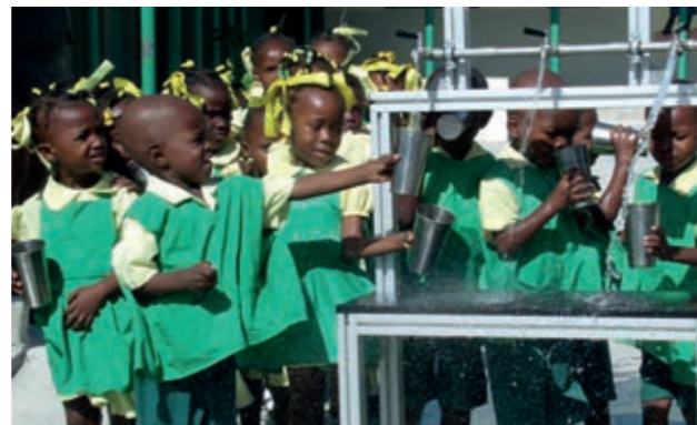
Grünbeck-Trinkwasseraufbereitungsanlagen in zwei SOS-Kinderdörfern am Rande der haitianischen Hauptstadt Port-au-Prince und im Norden des Inselstaats.

Zunächst einmal möchten wir etwas bewegen. Und dann: Dass das Handeln getragen ist von Erkenntnissen, Einfühlungsvermögen und der Motivation, gezielt zu helfen. Dort, wo es notwendig ist, um gesellschaftliche Gegebenheiten menschlicher und lebenswerter zu machen sowie dort, wo Menschen akut in Not sind oder Hilfe brauchen, um sich schnellstmöglich selbst helfen zu können. Seit mehr als 60 Jahren setzt sich Grünbeck für all das ein. Denn Hinschauen allein genügt nicht!