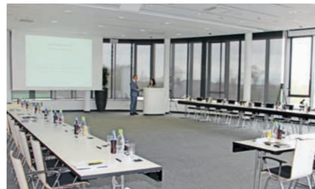
Wasser-Wissen weitergeben: Dafür bestens geeignet sind unsere technisch modern ausgestatteten Räume.