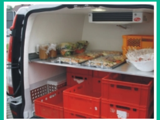
Heckansicht mit Zwischenböden