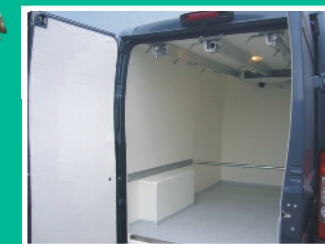
Hochdachkastenwagen mit Rohrbahn