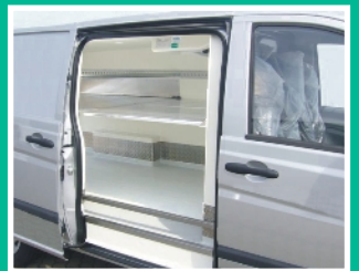
Seitenansicht mit Zwischenböden

Frischdienst- oder Tiefkühltransporter als Komplettlösung aus einer Hand ist unsere Spezialisierung. Besonderen Wert wird auf die Umsetzung des bedarfsgerechten jeweiligen Kundenwunsches gelegt. Die Gestaltungsmöglichkeiten sind vielfältig, ob als einfacher Hygiene-Ausbau ohne Isolierung oder als kompletter Frischdienst- oder Tiefkühltransporter mit Fahrt- und oder Standkühlung 230 V, mit herausnehmbarer Trennwand als Mehrkammerfahrzeug, mit Zwischenböden, Rohrbahnen, Regalen, Zurrschienen, zweiter Schiebetür, Scheuerschutz etc. Ein Hol- und Bringservice macht auch für überregionale Kunden eine Anfrage interessant.