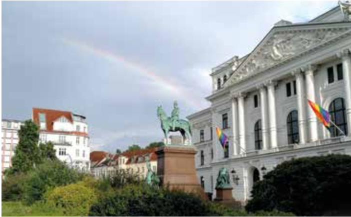
Bezirksamt Altona