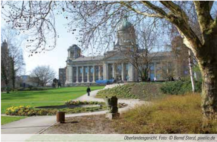
Oberlandesgericht, Foto: © Bernd Sterzl, pixelio.de