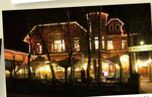
Zur jeder Tageszeit, von 11.00 bis 24.00 Uhr, lädt das Waldhaus zu Speis, Trank, Beisammensein und schönen Stunden.