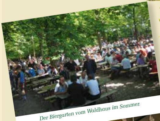
Der Biergarten vom Waldhaus im Sommer.