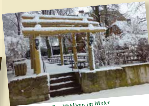
Das Waldhaus im Winter.