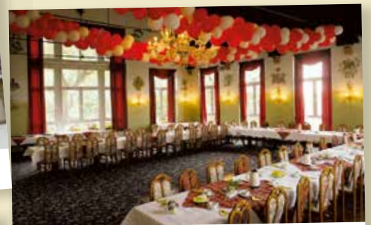
Im großen Saal stehen 200 Plätze für Hochzeiten, Jubiläen, Feste, aber auch Tagungen und Konferenzen zur Verfügung.