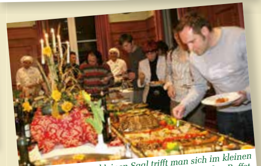
... nebenan im kleinen Saal trifft man sich im kleinen Rahmen oder lädt zum großen Buffet.