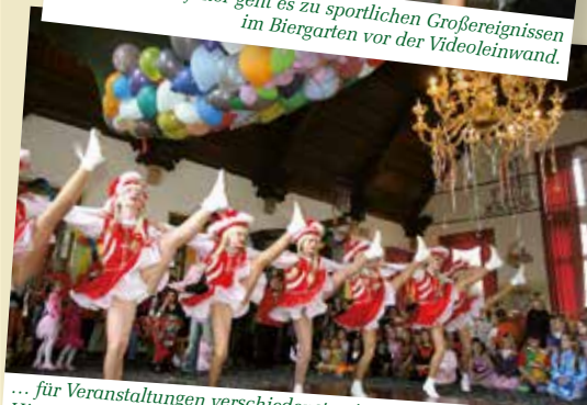
... für Veranstaltungen verschiedenster Art. Hier wird im Ballsaal unterm Kronenleuchter riesig Fasching gefeiert, ...

Besuchen Sie uns auch in Leipzig in der Brauerei an der Thomaskirche!