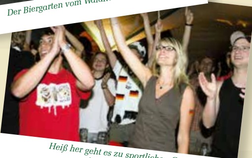
Heiß her geht es zu sportlichen Großereignissen im Biergarten vor der Videoleinwand.