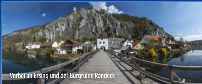
Vorbei an Essing und der Burgruine Randeck

A uf einem steil aufragenden Kalksteinfelsen über dem Altmühltal liegt die stolze Burg Prunn. Ihre majestätische Lage macht die Burg zu einer der bekanntesten Bayerns. Zudem ist sie Fundstelle der Prunkhandschrift des Nibelungenliedes. Fantastische Landschaften erwarten Sie auf dem Weg zum Luftkurort Riedenburg mit seinen romantischen Gassen und der majestätischen Rosenburg.